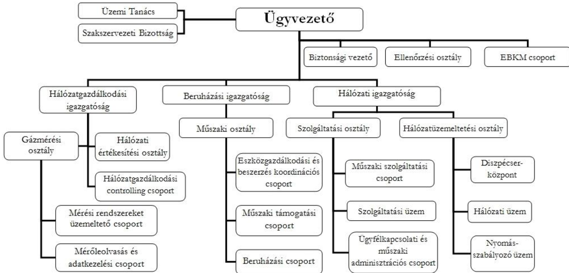
1.sz. ábra: NKM Földgázhálózati Kft. szervezeti felépítése. Hatályos: 2016. június 1-től